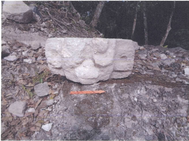
Encontrado en esquina NE, A-6