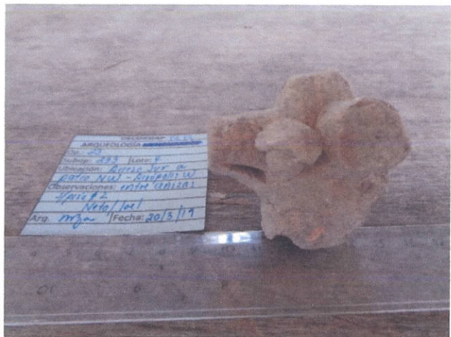
Encontrado en el acceso al patio